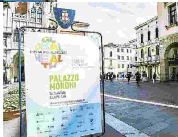
Tutti i luoghi del Festival sono contrassegnati con le locandine

Tra i temi di oggi le città sane, la medicina di genere, farmaci, ricerca e brevetti, epilessia, Aids e Tbc, immigrazione, la salute dei bambini, le sfide per la salute nel sud del mondo. Trenta gli incon-