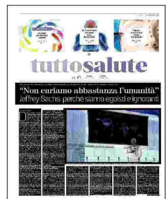
Jeffrey Sachs è professore alla Columbia University e direttore del «Center for Sustainable Development»